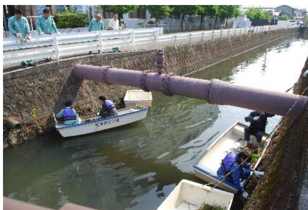
令和元年ボランティア清掃